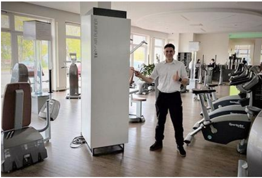
Enkele fitnesscentra adverteren reeds met „vrijwel virusvrije lucht“ dankzij de TROX luchtreiniger.

WORDT BETER DAN DE CONCURRENTIE. MET VEILIGHEID.