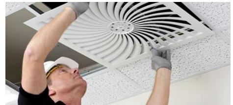
OUR SERVICES FOR YOUR ASSEMBLY /OPERATION