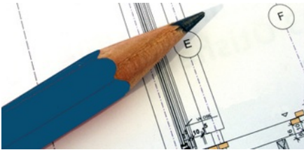
OUR SERVICE FOR YOUR DESIGN

TROX CUSTOMER SUPPORT ondersteunt klanten bij ontwerp, inkoop en in bedrijf stellen van installaties gedurende de hele levenscyclus van de installatie.